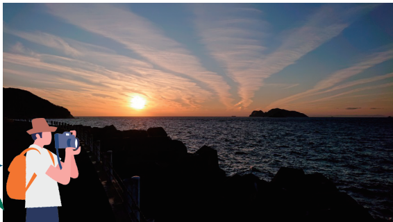
沖の島：古屋野地区から見る夕焼け