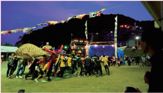
鵜来島：春日神社祭り