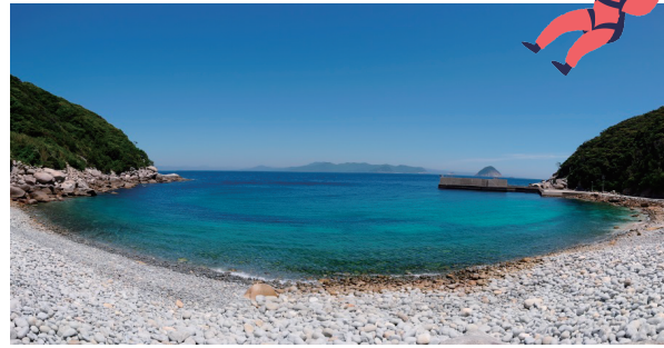
沖の島：久保浦地区の海岸