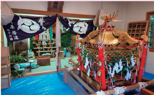
沖の島：母島集落 日吉神社祭り