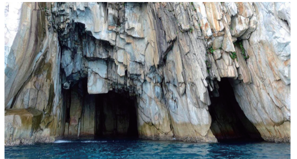
沖の島：セツ洞（島の岸壁に7つ連なる大穴群）