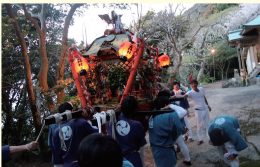
沖の島：弘瀬集落 荒倉神社祭り