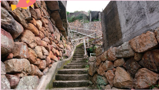
両島：石垣・石段とともにある暮らし

沖の島：5つの集落から構成されており、その内の母島集落の日吉神社、弘瀬集落の荒倉神社で春と秋にお祭りが行われる。夏には母島集落、弘瀬集落でそれぞれ花火大会も行われている。沖の島観光協会主催のイベントも例年催されるが、今年度はコロナの影響で全て中止。鵜来島：1つの集落から構成されており、春日神社で秋に祭りが行われる。2つの島ともに石垣で集落が構成されており、国土交通省が石垣・石段とともにある暮らし名義で島の宝100景に選出している。