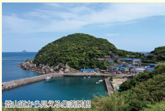
登山道から見える集落景観

住所：宿毛市沖の島町鵜来島 電話番号：0880-62-1242（宿毛市商工観光課） 料金：無料（来島時の船代金のみ） 営業時間：指定無し アクセス：鵜来島港から山頂まで約 1.3km ホームページ URL：無し 駐車場の有無：無し