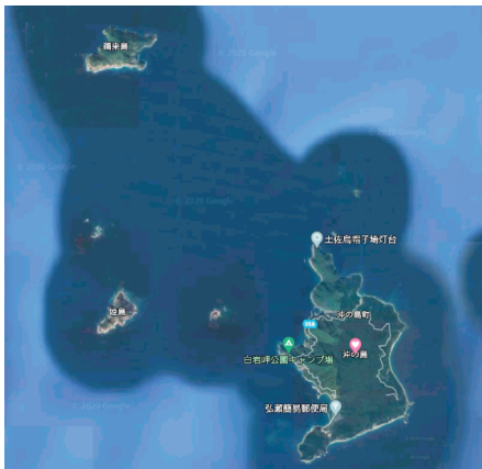
沖の島・鵜来島衛星写真