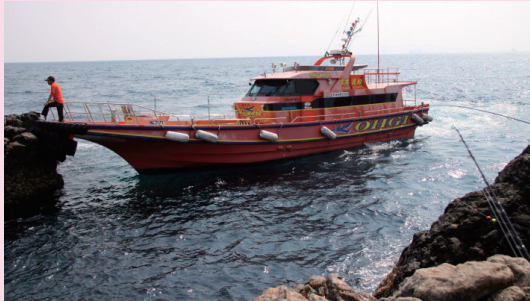
渡船業が磯に釣り客を降ろす様子