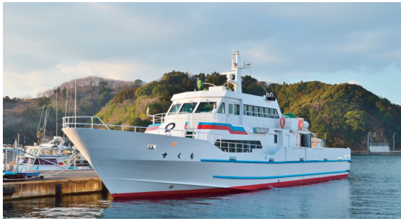
沖の島・鵜来島行き の 宿毛市営定期船「すくも」