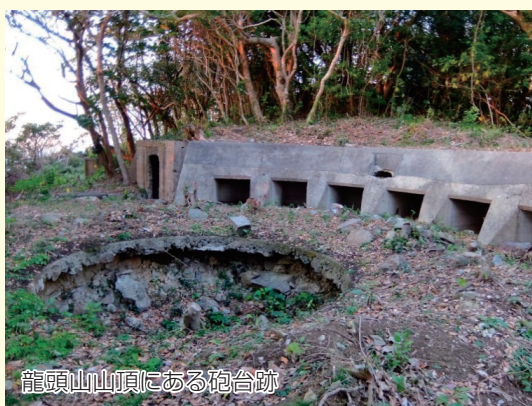
龍頭山山頂にある砲台跡

住所：高知県宿毛市沖の島町 電話番号：0880-62-1242（宿毛市商工観光課） 料金：無料（来島時の船代金のみ） 営業時間：指定無し アクセス：沖の島町母島から約 2.5km ホームページ URL：無 駐車場の有無：無（公園内に駐車可）