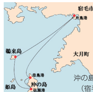
沖の島・鵜来島アクセスマップ (宿毛市営定期船航路図)