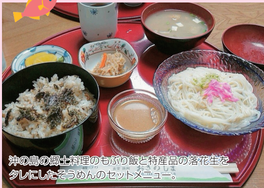
沖の島の郷土料理のもぶり飯と特産品の落花生を 夕しにしたそうめんのセットメニュー。