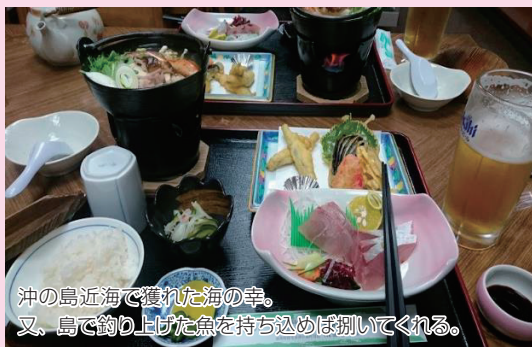
沖の島近海で獲れた海の幸。 又、島で釣り上げた魚を持ち込めば捌いてくれる。