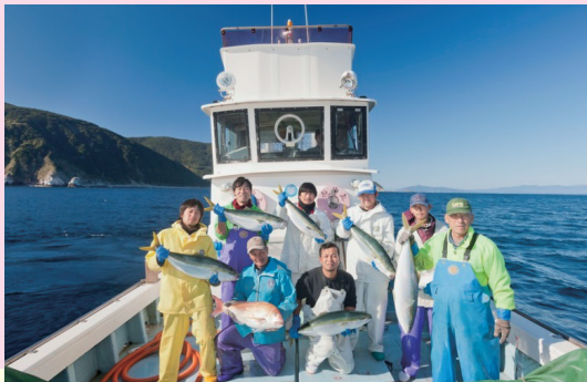
漁師の船上で釣果写真