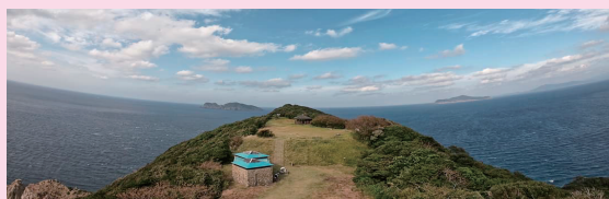
公園内の展望台からの眺望