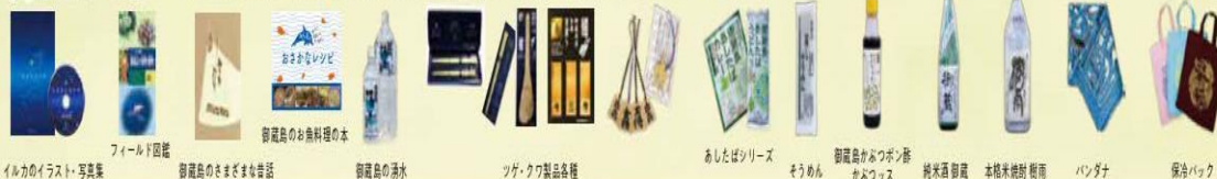
イルカのイラスト・写真集

商店・宿泊施設・飲食店でもオリジナル商品が販売されています♪ぜひ寄ってみてください。