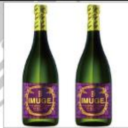
泡盛業界売上 NO.1 の泡盛