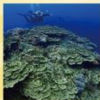
美しい海のダイビング