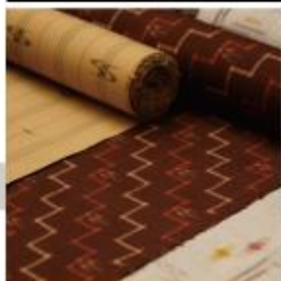
軸の発祥・久米島軸