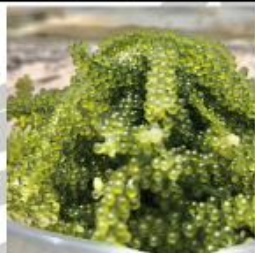
生産量日本一の海ぶどう