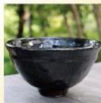
やちむん土炎房の陶器