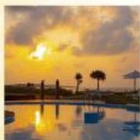
リゾートホテル宿泊