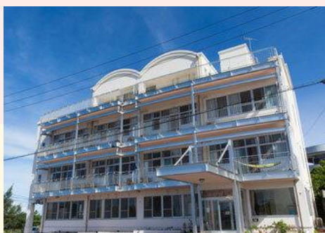
町営寮「じんぶん館」