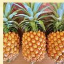
甘み凝縮のピナップル