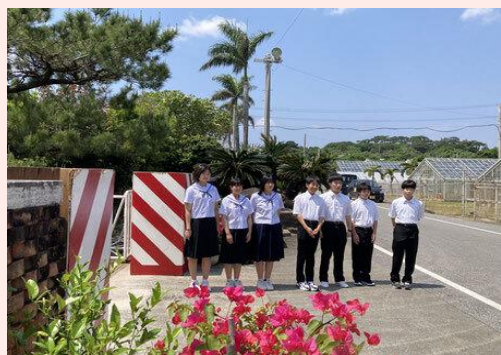
令和4年度の離島留学生たち