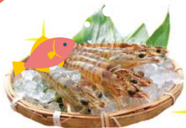
車海老の生産量日本一