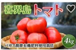
【2023年2月～発送】『喜界島トマト』バガス醗酵有機肥料使用栽培 4kg