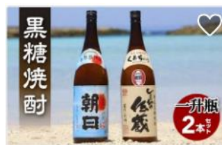
黒糖焼酎一升瓶2本セット(朝日・しまっちゅ伝蔵)