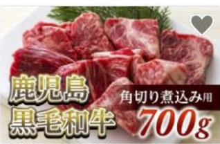
角切り煮込み用700g 鹿児島黒毛和牛【尾崎牧場産】