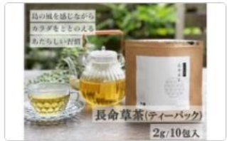
喜界島の長命草茶ティーバック(2g/10包入)