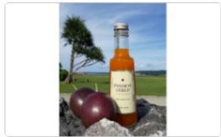
新商品!!【濃縮】パッションシロップ 240g