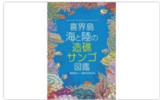
【喜界島】海と陸の造礁サンゴ図鑑 2022/09/16(金) 14:43