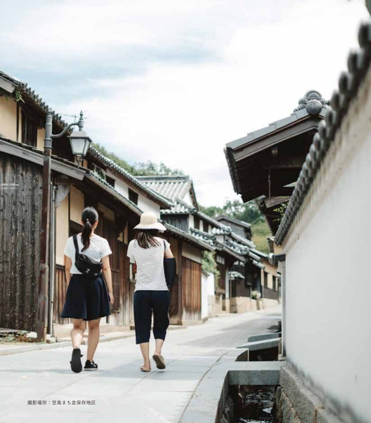
撮影場所：笠島まち並保存地区