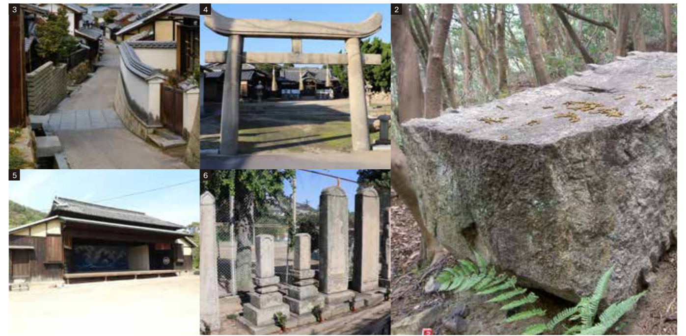
2 『塩飽本島高無坊山石切丁場跡』 大坂城築城時に細川家の丁場として稼働していた場所である。 3 『笠島集落』 当時の繁栄を象徴する港町。この場所は花崗岩の石量などと共に町屋建築が立ち並び、塩飽大工の伝統的な技術を今に伝えている。 4 『木鳥神社鳥居』 大坂城築城に関わったと伝説のある薩摩の石工紀加兵衛や地元の九郎兵衛らによって製作された。 5 『千歳座』 塩飽大工により1862年に建設された芝居小屋で、塩飽の繁栄や風俗を物語る貴重な建物として、今も島民らが活用している。 6 『年寄の墓』 塩飽衆の代表者である年寄の墓。高さ3mを超える花崗岩の碑が代々建立されており、年寄の権力の強さを彷彿させる。