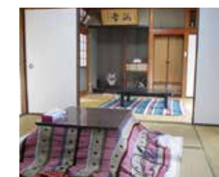
旅ねこ（体験型宿泊施設）

塩飽諸島最高峰の標高 312m で、山頂からは瀬戸内海が一望できます。山頂付近には、「王頭砂漠」が広がっています。