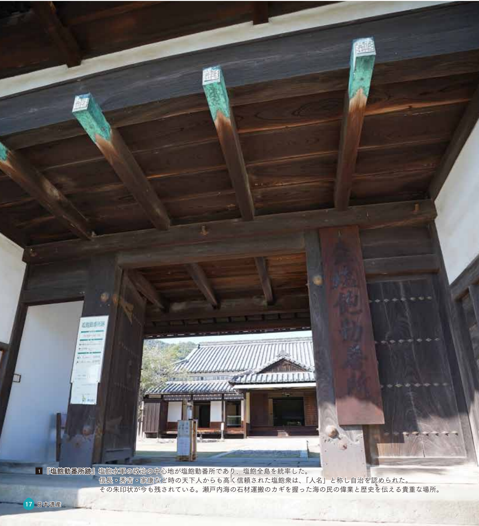
1 『塩飽勤番所跡』 塩飽水軍の政治の中心地が塩飽勤番所であり、塩飽全島を統率した。信長・秀吉・家康など時の天下人からも高く信頼された塩飽衆は、「人名」と称し自治を認められた。その朱印状が今も残されている。瀬戸内海の石材運搬のカギを握った海の民の偉業と歴史を伝える貴重な場所。

瀬戸内備讃諸島の花崗岩と石切り技術は、長きにわたり日本の建築文化を支えてきました。島々には、400年にわたって巨石を切り、加工し海を通じて運び、石と共に生きてきた人たちの稀有な産業文化が息づいています。世紀を超えて石を切り出した丁場は、独特の壮観な景観を形成し、船を操り巨石を運んだ民は、富と迷路のような集落を遺しました。今なお、石にまつわる信仰や生活文化、芸術が継承されています。