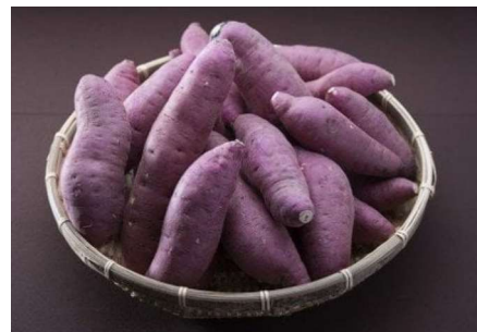
祝島産さつまいも (山田農園)