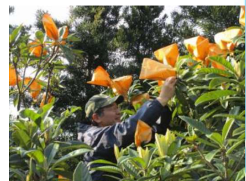
ビワの袋掛け作業