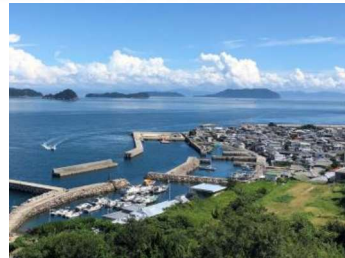
高台より集落を望む

高齢者が多いためヘルパーが不足しており、よく募集があります。他の雇用はあまりありませんが、手に職があり、自営で何か始められる方でしたらなんとか自立できると思います。島に必要とされる事業を始めれば歓迎されると思います。