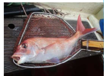
タイの一本釣りで有名