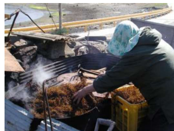
ヒジキの釜炊き作業