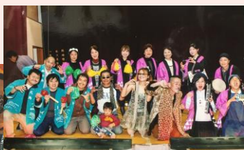
佐久島小・中学校 島民ふれあい学芸会『歌謡・演芸大会 西区校』 2016.11.2