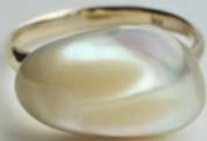
世界にひとつしかない夜光貝Jewelry Yakougai Ring k18