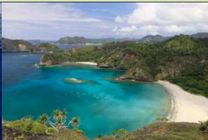
【小笠原諸島の位置】